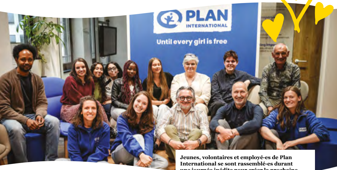
Jeunes, volontaires et employé-es de Plan International se sont rassemblé-es durant une journée inédite pour créer la prochaine campagne de Plan International en mai 2025.

Donateur-rices, bénévoles, jeunes, entreprises partenaires, écoles et sympathisant-es s'engagent chaque jour pour les droits des filles et l'égalité de genre à travers le monde. Leur engagement, leur énergie et leur créativité sont le moteur de notre ambition.